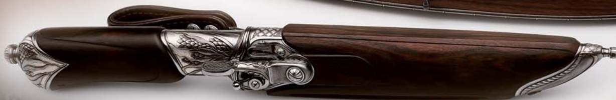
Нож в ножнах с комплектом инструментов «Лошина»

Москва, 2008 г. Автор – М. Жерядин. Сталь, нержавеющая сталь, белый металл, дерево «Макасар», «Палисандр», «Палисандр», кожа. Ковка, гравировка, выколотка, ташировка, канфарение, оксидирование, гальваностатика, смешанные техники.